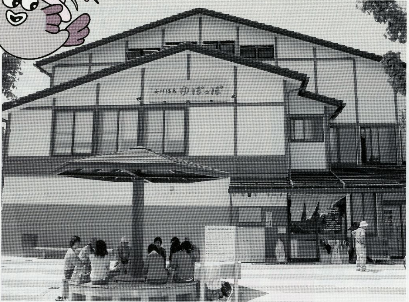
4月にオープンした「女川温泉ゆぼっぼ」。JR石巻線女川駅すぐそば。天然温泉を源泉かけ流しで使用。