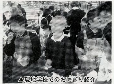
△現地学校でのおにぎり紹介