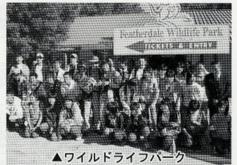
△ワイルドライフパーク