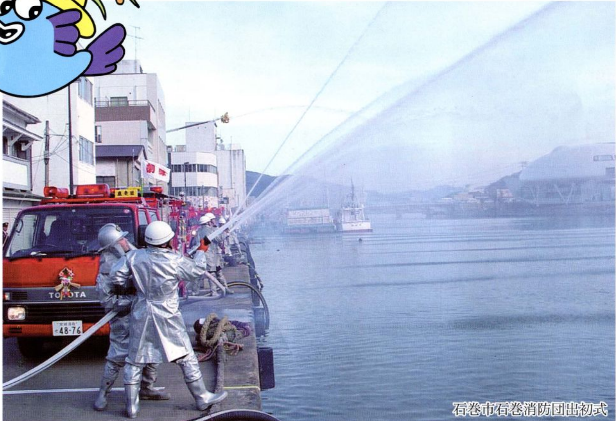
石巻市石巻消防団出初式