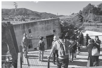
▲女川町(旧女川交番)