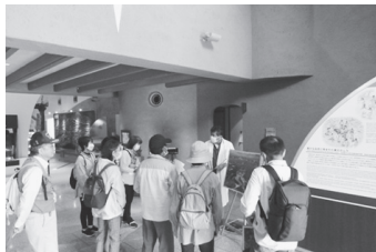
▲東松島縄文村歴史資料館