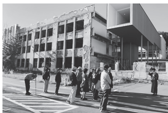
▲石巻市震災遺構門脇小学校