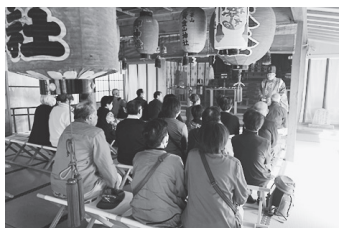
▲金華山(黄金山神社)