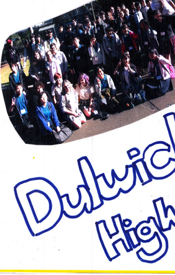
Dulwich High School