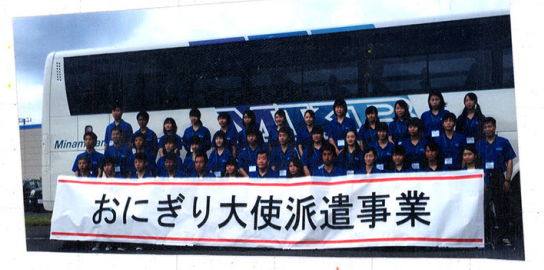
おにぎり大使派遣事業

おにぎり作りをしました。ホストファミリーが時に気に入ってくれたのは、おにぎりが美味しかった。初めて使う炊飯器で、おにぎりが美味しかった。 三日目の午前中、公園でクリケットやサッカーをしました。おにぎりが美味しかった。初めて使う炊飯器で、おにぎりが美味しかった。