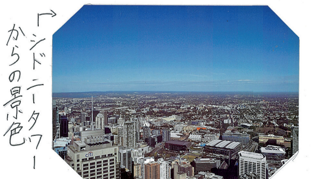
シドニータワーからの景色

私達は初日にシドニー市内を観光しました。まず、ミセス マッコリズポイントに行ったら、オペラハウス、セントメアリーの大聖堂に行きました。オーストラリアには近代的なビルと、伝統的なヨーロッパ建築が混在していて私達にはとても新鮮で美しく感じる瞬間がありました。