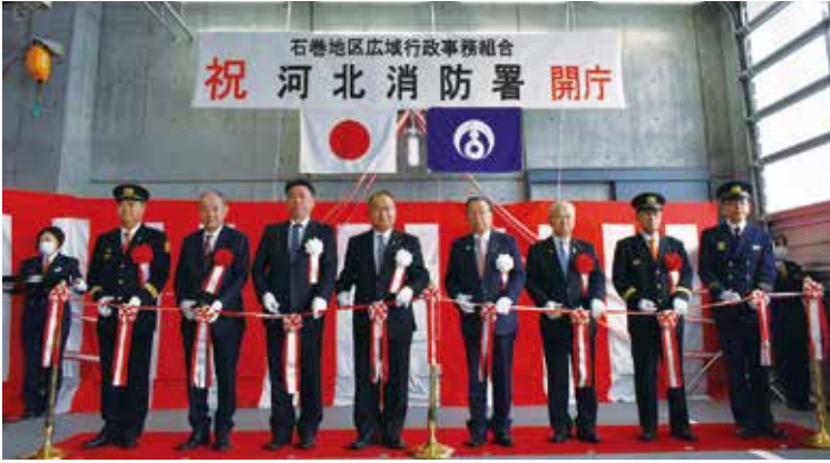
▲河北消防署開庁式の様子

拠点として、数々の災害に対応してきましたが、この度、老朽化に伴い新庁舎を新設いたしました。 今後とも地域住民の皆様への安全・安心を守るべく、職員一丸となり、「災害に強いまちづくり」を目指して専心努力してまいります。